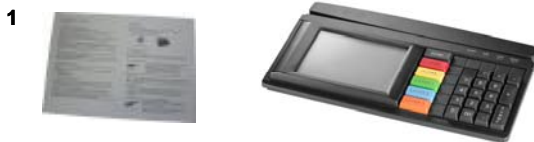
Bild 1 Verpackungsinhalt, Abbildung zeigt spezifisches Tastenlayout