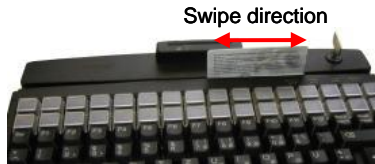
Fig. 7 Magnetic stripe reader

The magnetic card can be swiped through the reading device in both directions ( Figure 7 ). This provides easy manipulation for both right- and left-handers