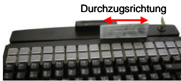
Bild 4 Magnetkartenleser

Es können alle Magnetkarten nach ISO 7810 und 7811 gelesen werden. Der Magnetkartenleser erfasst den gesamten Informationsgehalt der Magnetkarte. Nach einem gültigen Lesevorgang erfolgt ein LED-Signal (Accept-LED grün).