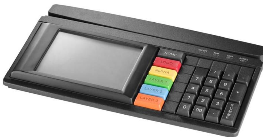
Figure shows a specific keyboard layout Abbildung zeigt spezifisches Tastenlayout