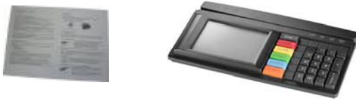
Fig. 1 Contents of package, figure shows a specific keyboard layout