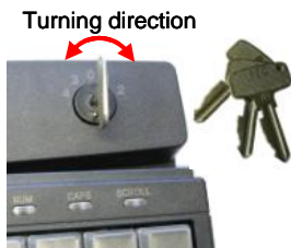
Fig. 8 Keylock

The optional keylock ( Figure 8 ) module has 5 positions and is supplied with 3 different keys.