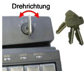
Bild 5 Schlüsselschalter

Das Optionsmodul Schlüsselschalter (Bild 5) besitzt 5 Stellungen und wird mit 3 verschiedenen Schlüsseln ausgeliefert.